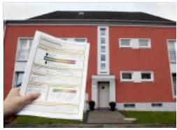
Saniertes Haus mit Energieausweis

Durch die Novellierung der Energieeinsparverordnung (und der Heizkostenverordnung) werden die Beschlüsse der Bundesregierung zum Integrierten Energie- und Klimaprogramm (IEKP) im Gebäudebereich umgesetzt.